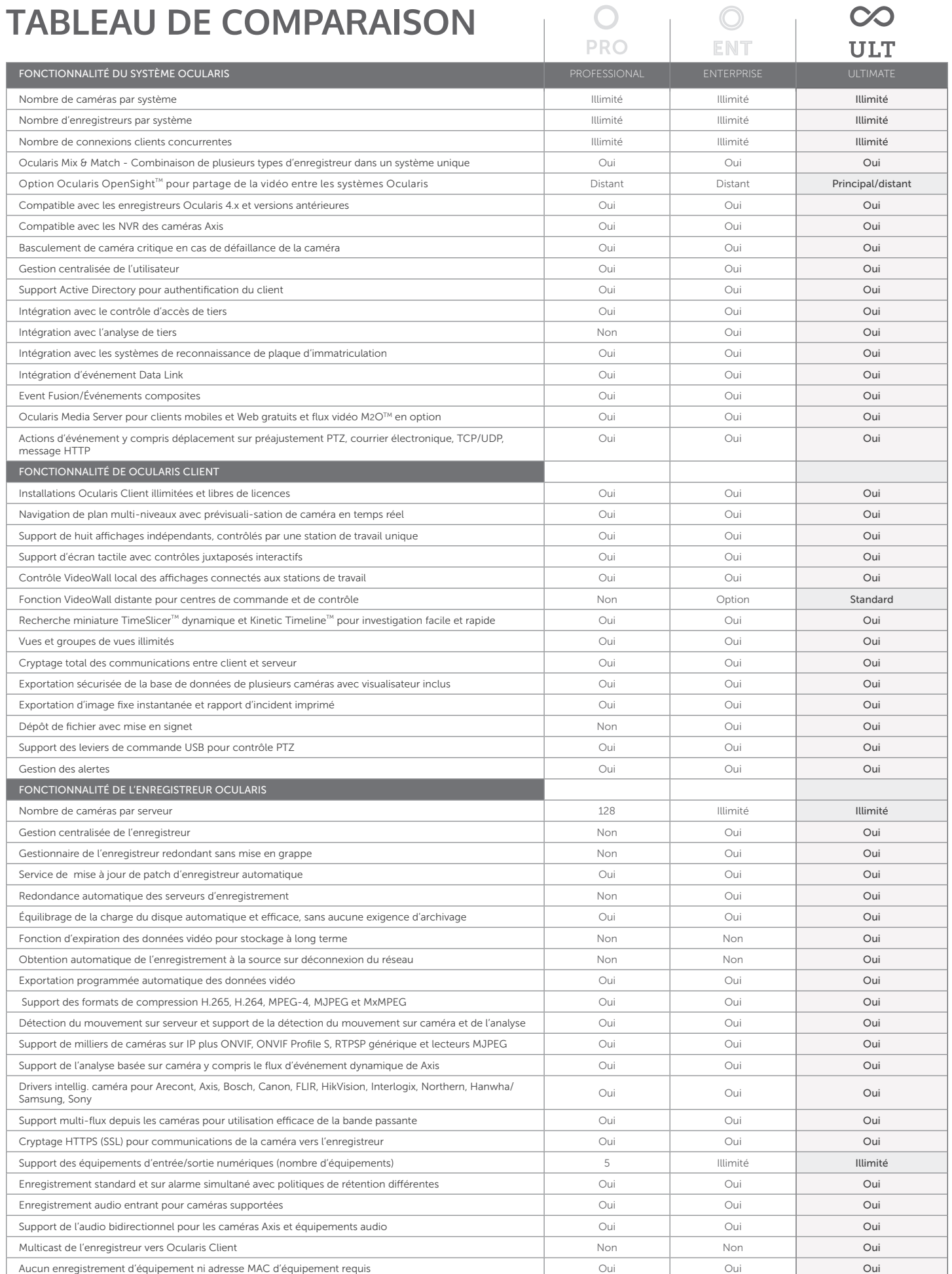
TABLEAU DE COMPARAISON

Libre de modifications sans préavis - Suivant les références produits - FP_Novadis_Ocularis_Ult_5.5_FR201805